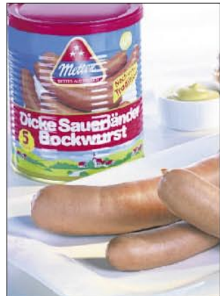
Das Markenzeichen der Firma Metten: Die Dicke Sauerländer.

E-Mail: info@GTEC.de Internet: www.GTEC.de