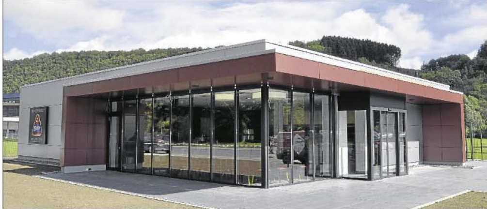
Das neue Gebäude ist fertiggestellt: Am kommenden Samstag wird der Metten Outletstore im Industriegebiet eröffnet.

57368 Lennestadt-Oedingen Tel. 0 27 25/95 44 10 Fax 0 27 25/9 54 41 20